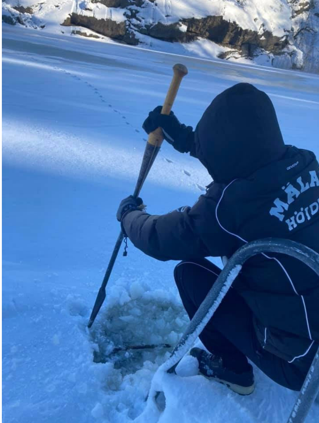
Foto: Isbillen är bra att ha, särskilt när inomträningen uteblir (MIK Sound)

Forskningen är entydigt gällande fysisk och psykisk hälsa för barn, unga och vuxna med funktionsnedsättningar. Då kan deltagandet i ett fotbollslag vara till stor hjälp. Lika viktigt som rörelsen/pulsen och självständigheten är lagsammanhållningen. Under en pandemi är möjligheterna till att träffas och träna ännu mer begränsade än vanligt. Till exempel, det är inte bara 'ut och springa själv' om personen är beroende av ledsagning. Därför har vi följt rekommendationer och ställt om till bl.a. löpning, isbad och vinterträning utomhus i mindre grupper.