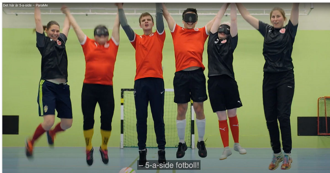
– 5-a-side fotboll!