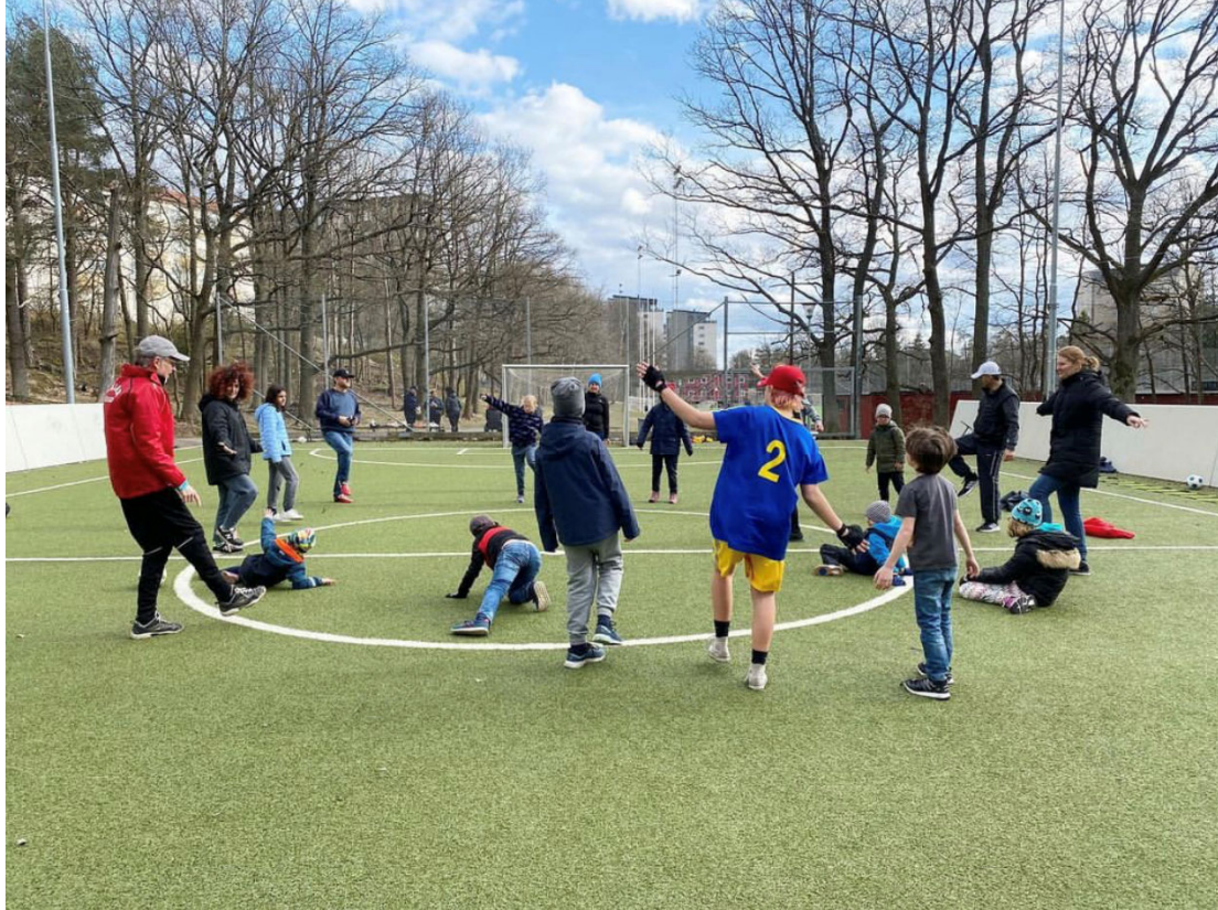
Foto: Balansövning med MIK All Stars Junior (MIK All Stars Junior)