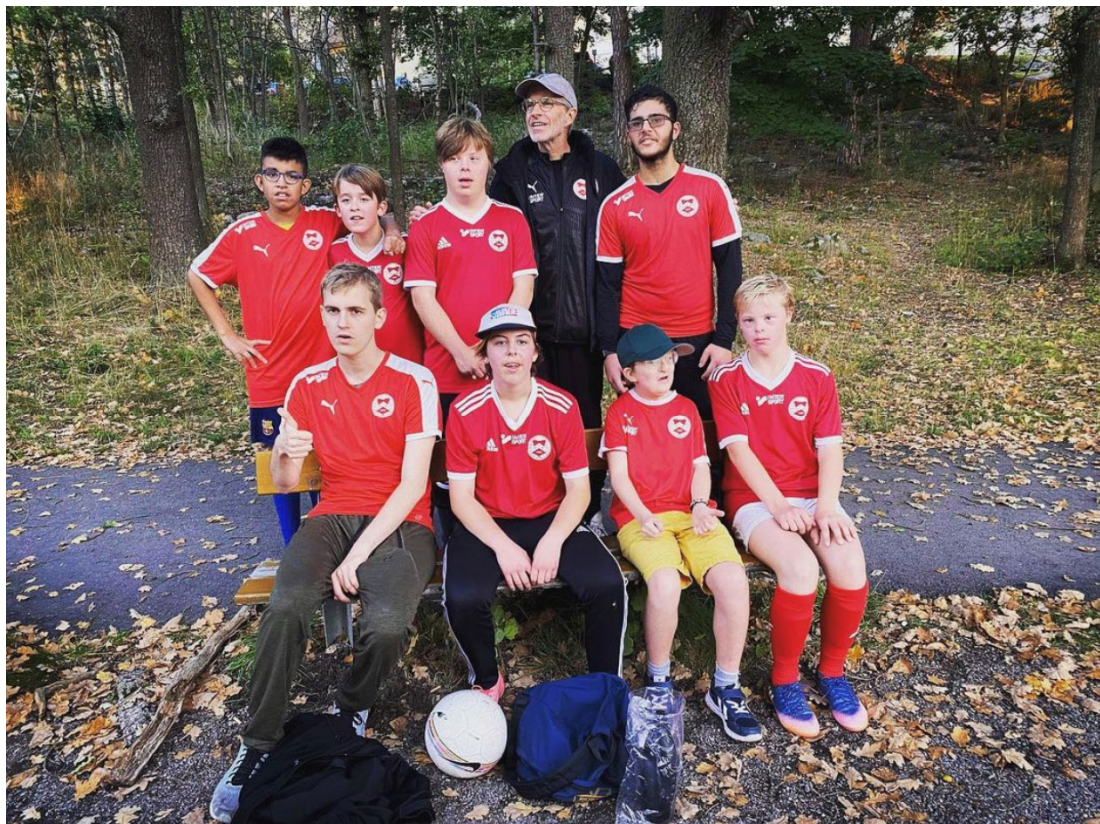
Foto: MIK All Stars efter vänskapsmatchen mot Järsla (MIK All Stars)